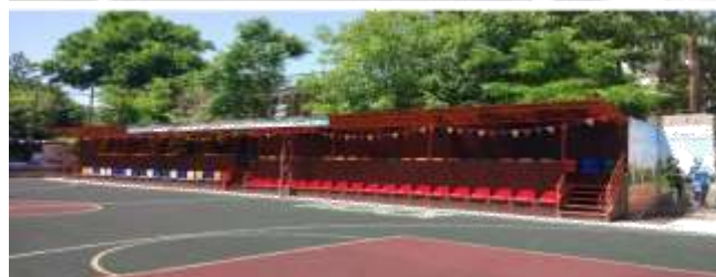
Характеристика зданий учреждения: