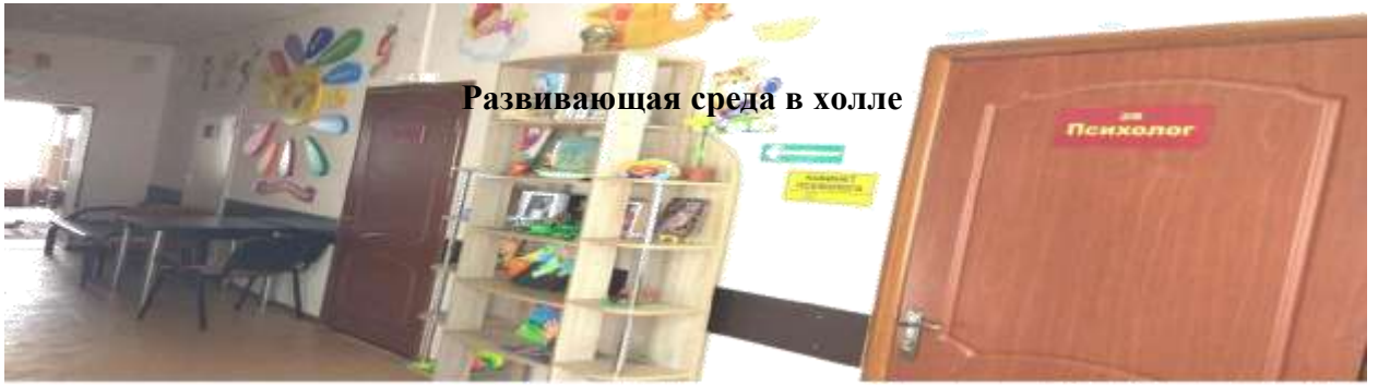
Развивающая среда в холле